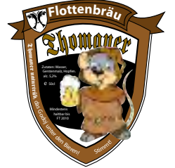
Illustration Maus: Heike Georgi